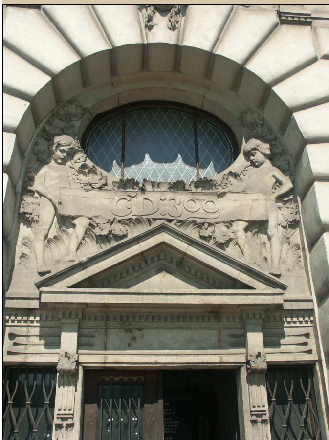
pískovcová výzdoba plochy v oblouku