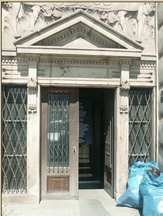
dveřní křídla se sloupky a římsou nesoucí štít