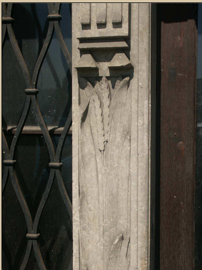
detail výzdoby sloupku